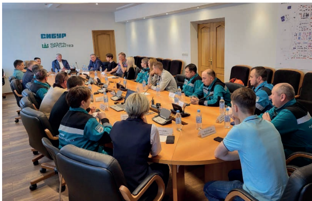
Во встрече приняли участие 20 уполномоченных по ОТ из различных подразделений предприятия