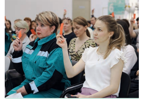
В голосовании приняли участие 58 делегатов от каждого завода

У нас есть замечательная практика – это профсоюзные завтраки. В рамках таких мероприятий каждый сотрудник может что-либо предложить, озвучить проблему. Для профсоюза очень важно знать, что волнует коллектив. После мы будем решать поставленные коллективом задачи. Таким образом, проблемы каждого должны решиться в рамках нашей работы.