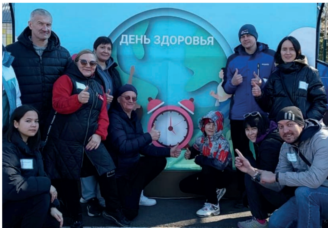
У каждого праздника – своя интересная программа мероприятий, объединенная тематикой спорта и здорового образа жизни

На базе детского лагеря «Солнечный» состоялись семейные праздники улыбок, здоровья и спорта для членов профсоюза «Казаньоргсинтез». Первыми участниками мероприятия стали сотрудники завода Этилена, ЦЛО, ЦЗЛ, РП метрология – они посетили площадку 1 апреля. 8 апреля эстафету подхватили сотрудники завода БФА, ПК и Управления общества, а 15 апреля на празднике встретились сотрудники ПППНД, ОПиТГ, ПВД, Энергопроизводство, РП Энергетика, РП Механика, СУН.