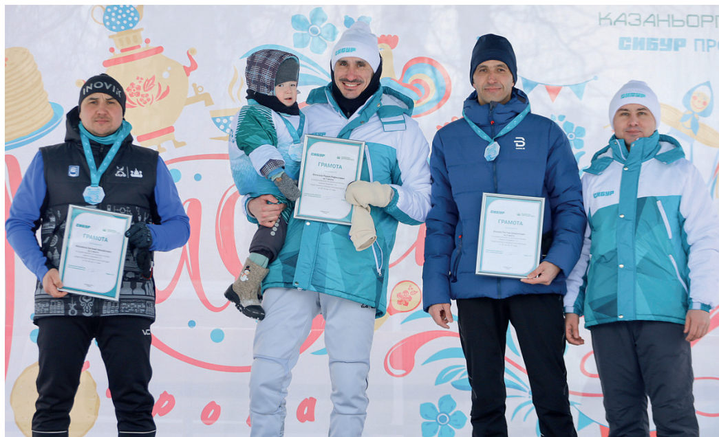
Победители лыжной гонки получили призы от профсоюза