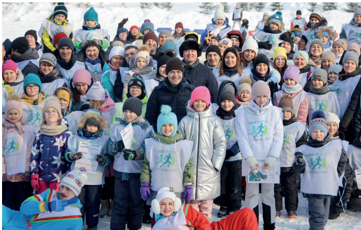
По итогам всех конкурсов были определены победители в трех возрастных группах детей: «5-8 лет», «9-12 лет», «13-16 лет»