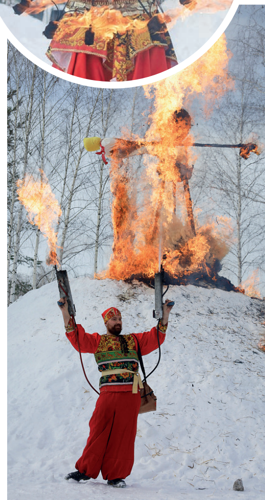
Кульминацией праздника стало сжигание чучела – символа уходящей зимы. Для безопасности гостей все проходило под чутким присмотром пожарных.