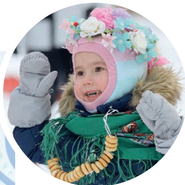
Счастливы и дети, и взрослые – Масленица удалась на славу!