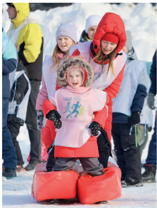
Самыми активными участниками соревнования, конечно же, были дети!

В этот день для участников на территории лагеря было много развлечений. Например, отдельная комната с играми для самых маленьких. Согреться можно было в помещении за просмотром мультфильмов или же на