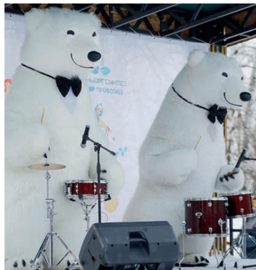
Выступления фолк-группы MOLVA, а также фееричное барабанное шоу в исполнении белых медведей зрители встречали громкими аплодисментами