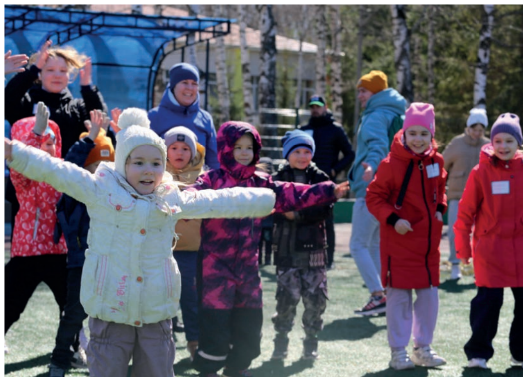
Сибурята - самые активные участники «Дня здоровья» 15 апреля

«Понравилось то, что праздник был организован именно как семейный. Смогли оторвать детей от гаджетов и вместе с ними весело провести время на свежем воздухе. С удовольствием снова примем