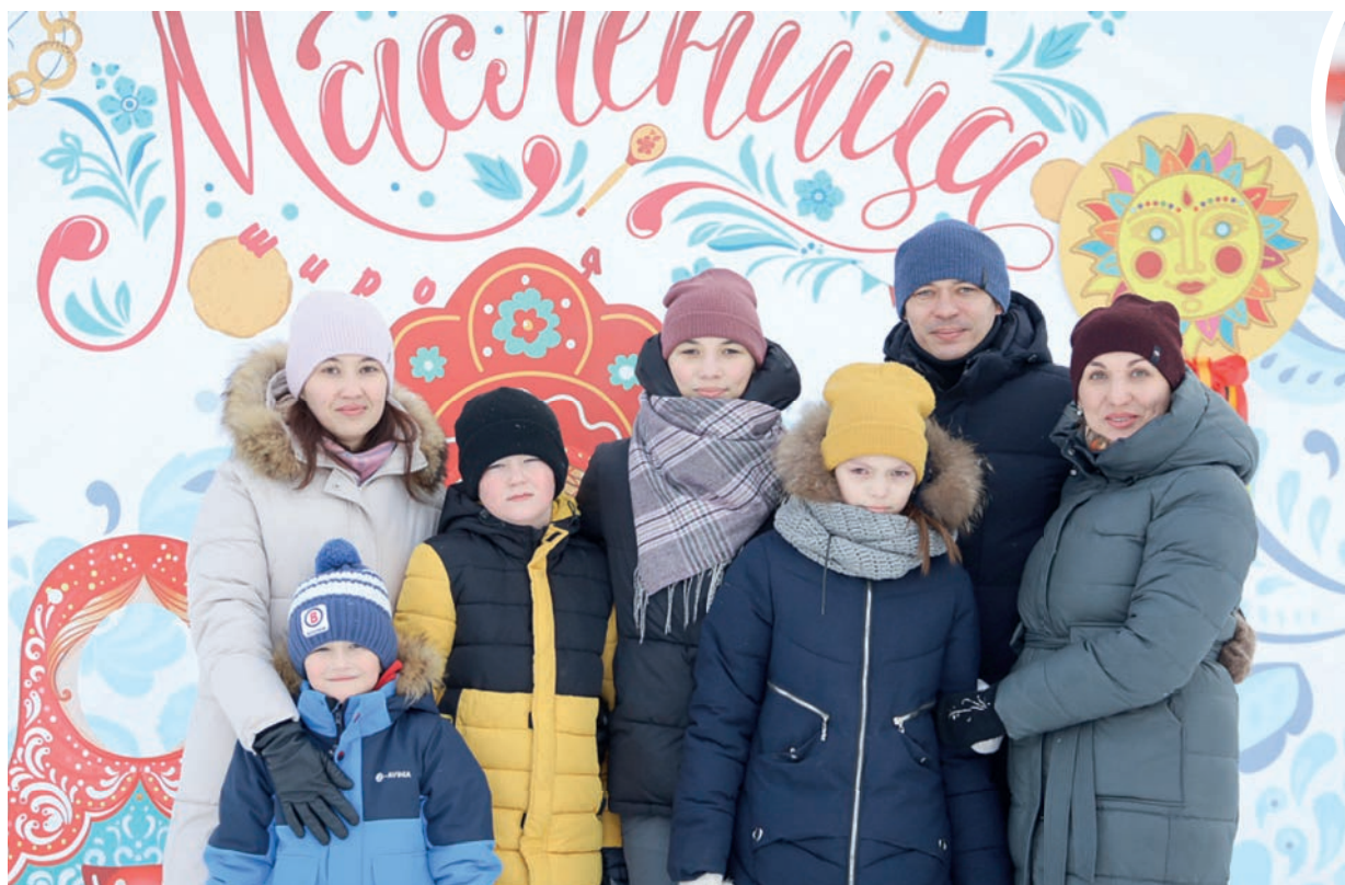
Гостями праздника стали около 800 сотрудников нашего предприятия и членов их семей

Параллельно с народными гуляниями на стадионе детского лагеря «Солнечный» состоялся лыжный забег имени Г.Н. Эпаевой. Участники соревновались в нескольких категориях: мужчины, женщины, ветераны, дети. Незадолго до окончания праздника были подведены итоги лыжной гонки и награждены победители.