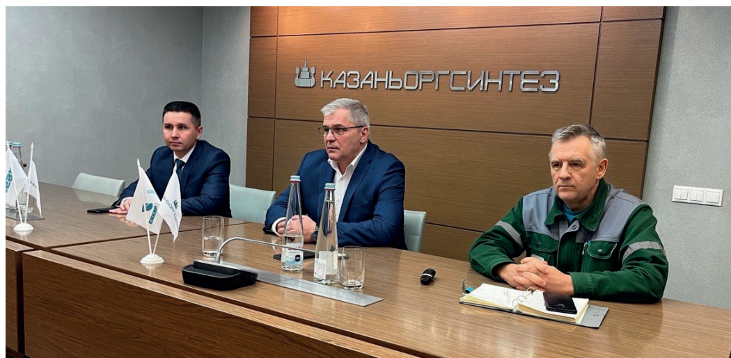
На «Казаньоргсинтезе» выбраны 193 уполномоченных по ОТ. В этом году они примут участие в двух обучающих сессиях