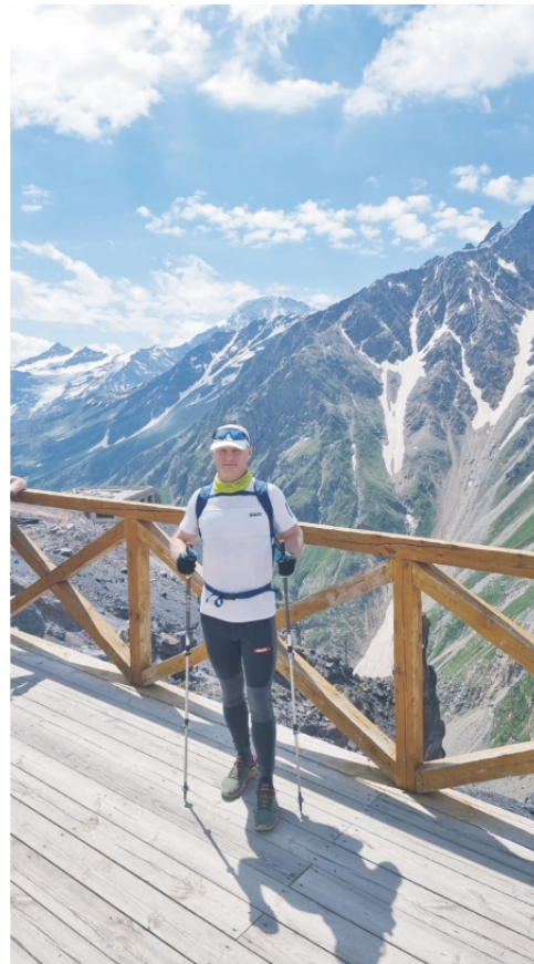
▲ Группа регулярно совершала восхождения в горы в формате скандинавской ходьбы

Занятия на лыжероллерах проводились на автомобильном шоссе. Поначалу это вызывало некие опасения с точки зрения безопасности,