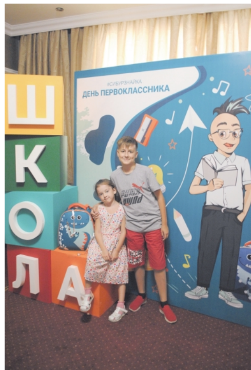
▲ Подарки первоклассникам – ранцы с набором канцтоваров – добрая традиция в СИБУРе