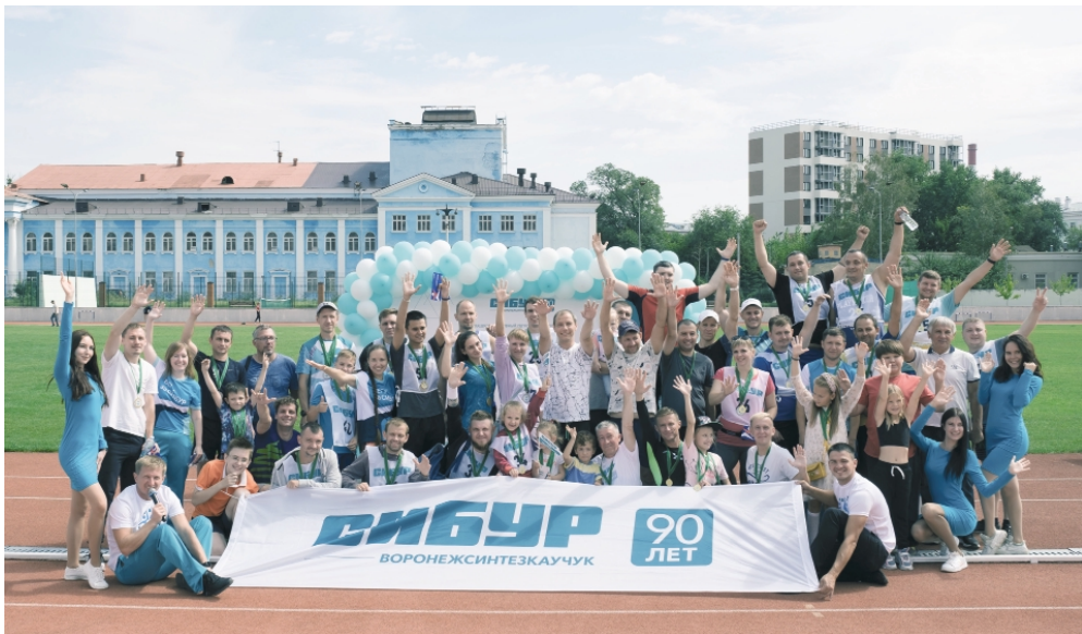
▲ Кросс «Вперед к здоровью» – один из самых ярких спортивных праздников!

75 спортсменов – сотрудников АО «Воронежсинтезкаучук» и их детей – стали участниками общекорпоративного легкоатлетического кросса «Вперед к здоровью», который состоялся 20 августа на стадионе «Буран».