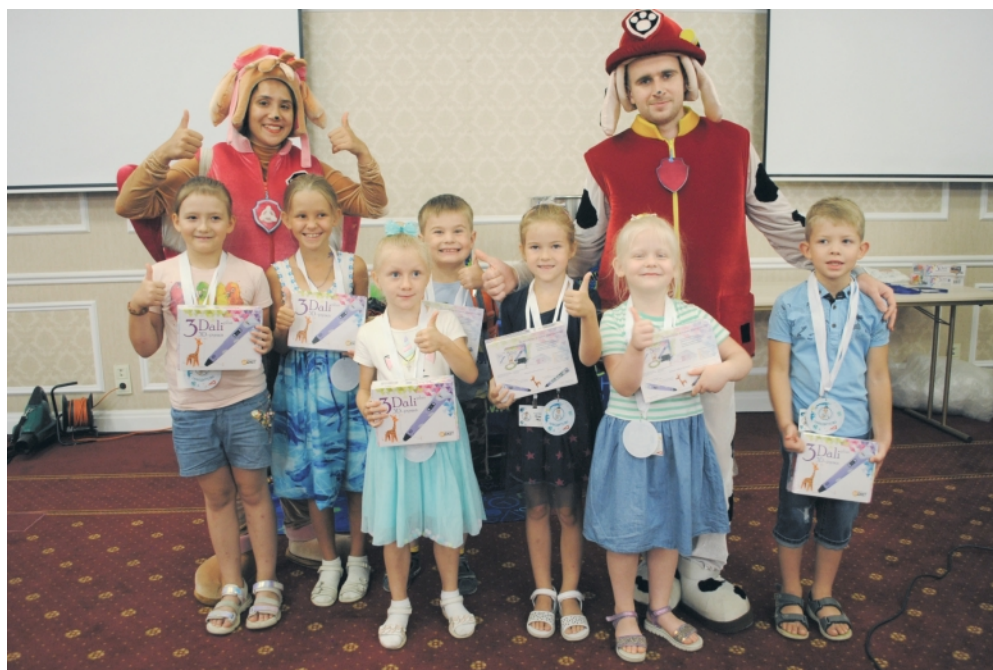
▲ Дети отлично справились с вопросами викторины «СИБУР Знайка», а чемпионом по числу правильных ответов стала команда «Апельсин»

И конечно же, все будущие первоклассники получили подарки от компании СИБУР – «дино-ранцы» с набором канцтоваров. Все, что необходимо для отличной учебы и новых знаний!