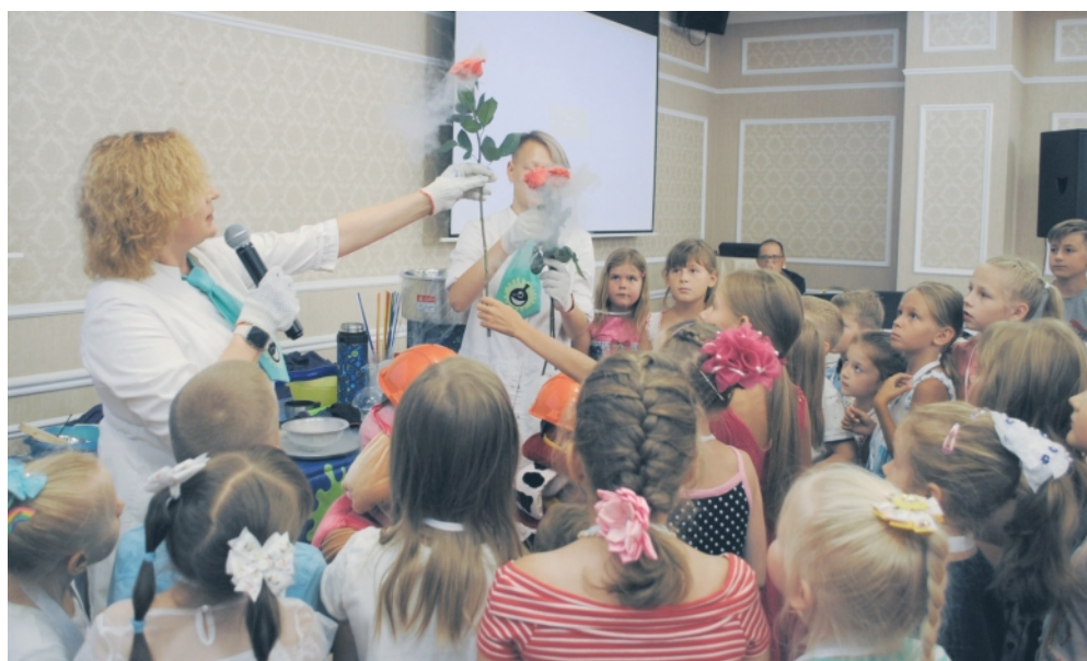
▲ Химические опыты – настоящее волшебство для юных зрителей!