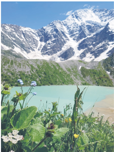
▲ Красоту природы в Кабардино-Балкарии сложно передать на словах – это надо увидеть своими глазами

В 2020 году основной целью нашего лагеря была общефизическая подготовка. А в этом году тренировочный процесс был направлен на отработку технических приемов лыжных ходов – конькового и классического. Тренировались на лыжероллерах. Катание на них во многом схоже с беговыми лыжами. Так что моя поездка в лагерь являлась одним из этапов подготовки к зимнему сезону 2022–2023 гг.