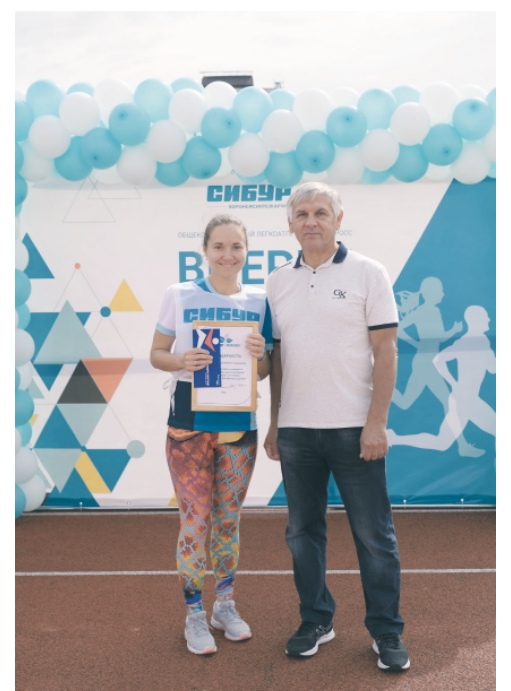
▲ Награды за вклад в командный результат на Летней Спартакиаде СИБУРа-2022, а также за развитие спортивных направлений на предприятии получили 14 сотрудников