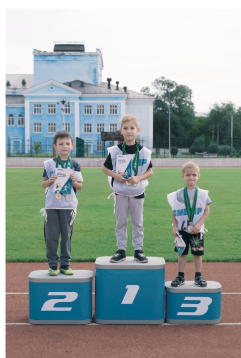
▲ Призы от профсоюза АО «Воронежсинтезкаучук» – для всех юных спортсменов!