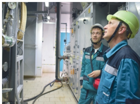
▲ Уполномоченные по охране труда принимают активное участие в проверках в рамках проекта «Месячник безопасности»

Приведу несколько примеров из своей практики. С наступлением холодов все сотрудники обязаны сдать велосипеды, на которых они передвигаются по территории предприятия, в камеру хранения. И вот я вижу, что один из моих коллег собирается садиться на велосипед. Соответствующее распоряжение вышло, да и погодные условия уже не располагают к использованию двухколёсного транспорта. Я остановил сотрудника, провёл беседу, объяснил опасность его действий. Он заверил, что сегодня же поставит «железного коня», после чего пешком последовал до камеры хранения, держа велосипед за руль. Я проводил коллегу взглядом и убедился в безопасности его действий.