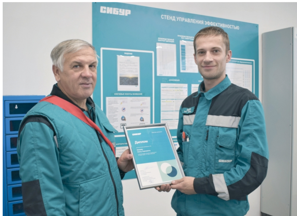
▲ Наш коллега не раз становился призёром ежеквартального конкурса «Лучший уполномоченный по охране труда»

«Правила все знают, СИЗ тоже в наличии, но при этом звучат оправдания: «Мне так удобно работать», «Да я сейчас быстренько сделаю». Приходится постепенно менять сознание людей, постоянно напоминать о требованиях