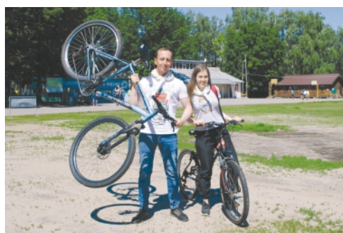
▲ В числе любимых семейных активностей – велосипед и сапборд

– В тёплое время года я практически каждый вечер нахожу время для ходьбы, поскольку для меня это не только способ держать себя в форме, но и отдых от сидячей умственной работы.