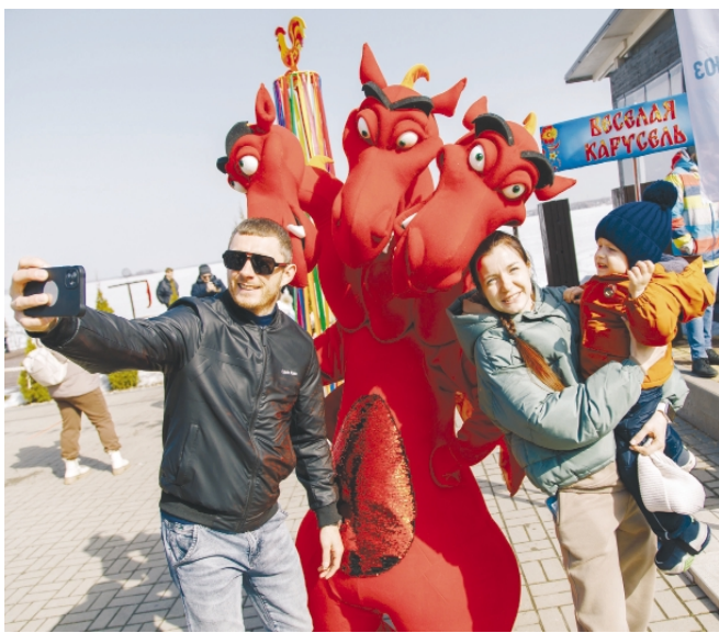
Встретили весну с праздничным задором!

Народная, старинная, румяная да блинная – вот она какая, наша профсоюзная Масленица, которая состоялась 16 марта.