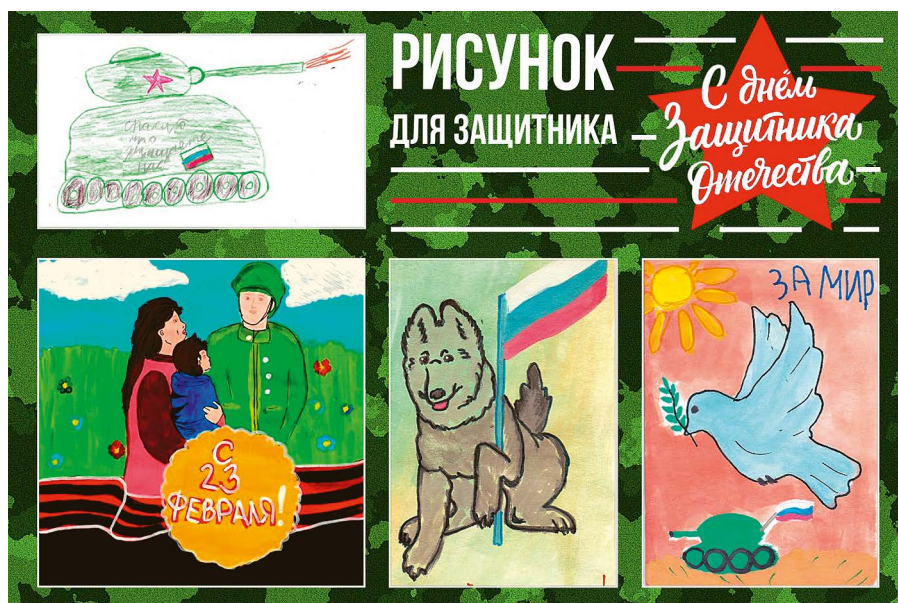
РИСУНОК ДЛЯ ЗАЩИТНИКА

В целях патриотического воспитания и выявления творческих способностей ребят профсоюзная