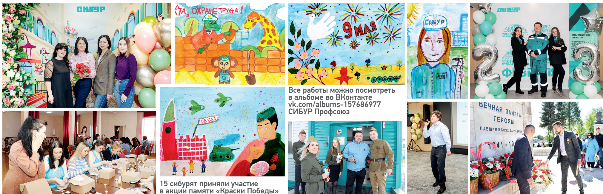
Все работы можно посмотреть в альбоме во ВКонтакте vk.com/albums-157686977 СИБУР Профсоюз

ПРАЗДНИКИ, ТВОРЧЕСКИЕ ВЕЧЕРА, МАСТЕР-КЛАССЫ, АКЦИИ КО ДНЮ ПОБЕДЫ