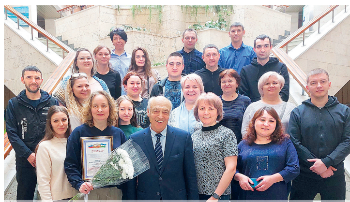
▲ На мероприятии прошло торжественное награждение победителей XX смотра-конкурса на звание «Лучший уполномоченный по охране труда Федерации профсоюзов Республики Башкортостан» по итогам 2022 года

21 Уполномоченный по ОТ ПОЛИЭФ прошел обязательное обучение в Доме профсоюзов в Уфе 18 – 19 апреля.