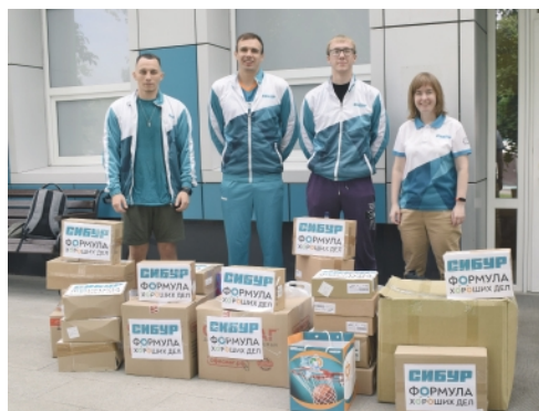
▲ Большое спасибо всем сотрудникам нашего предприятия, которые приняли участие в благотворительной акции и помогли детям из приюта «Покров» подготовиться к новому учебному году!

29 августа наши корпоративные волонтеры передали канцтовары в приют «Покров» в Отрадном. Спортсмены провели для ребят урок физкультуры, посвященный теме баскетбола, и вручили администрации приюта экологичный баскетбольный мяч, которым играют звезды Единой Лиги ВТБ.