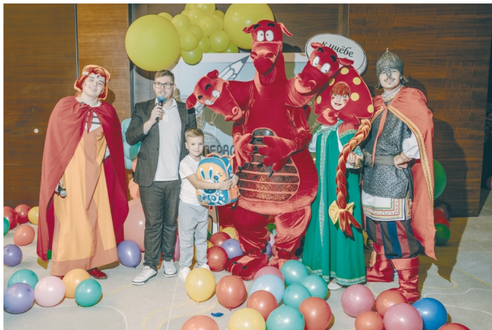
▲ Дети с гордостью примеряли ранцы и радостно восклицали: «Мы – первоклассники!». «Мы тоже!», – со смехом отвечали родители, вспоминая свои школьные годы

Накануне нового учебного года наши сибурята зарядились позитивом в лагере «Солнечный», первоклассники по традиции получили ранцы от компании СИБУР, а сотрудники предприятия помогли собраться в школу детям, проживающим в приюте «Покров».