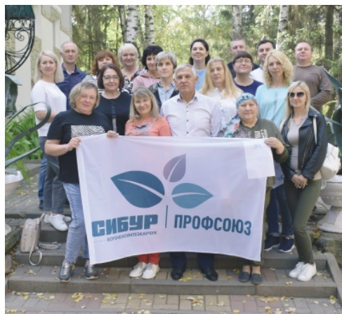
▲ Штатные работники первичной профсоюзной организации рассказали о приеме в члены профсоюза и формировании сметы доходов и расходов, об основных каналах коммуникации и порядке оформления заявлений на материальную помощь через мобильное приложение «СИБУР Профсоюз 2.0»

26-27 сентября председатели цеховых комитетов приняли участие в выездной развивающей сессии, организованной профсоюзом АО «Воронежсинтезкаучук».