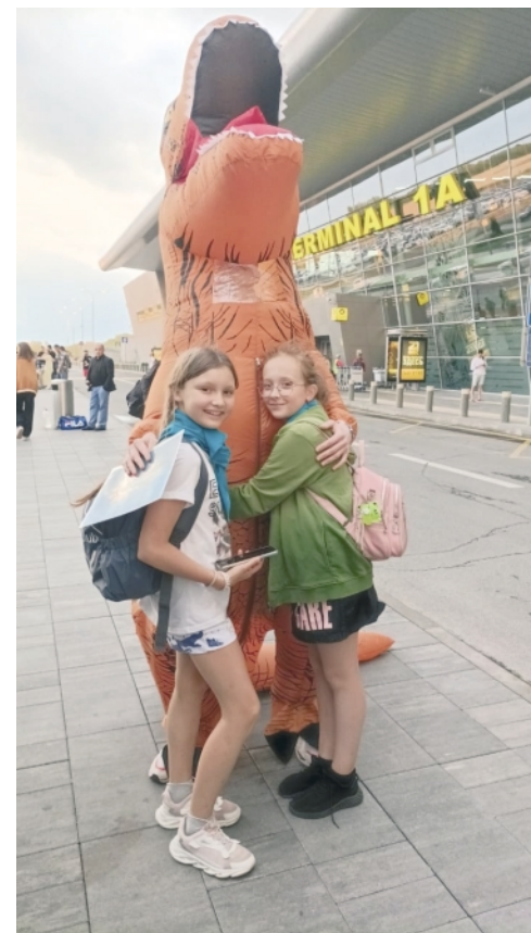
▲ Яркие каникулы – счастливое детство!